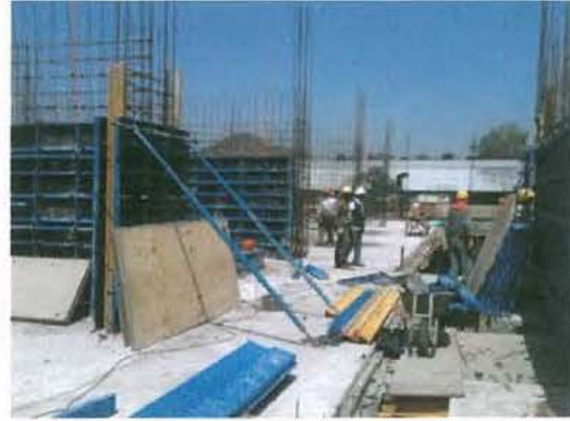
FOTOS N° 3 Y 4 TRAZADOS Y MOLDAJES