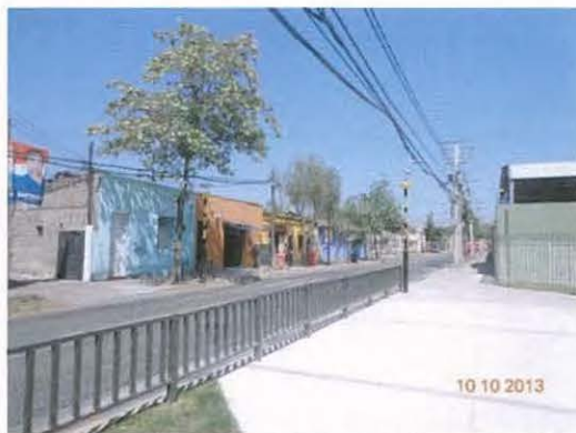
FOTOS N° 25 y 26 MITIGACIÓN VIAL – BAHIA ESTACIONAMIENTO, VALLAS PEATONALES Y CRUCE DEMARCADO