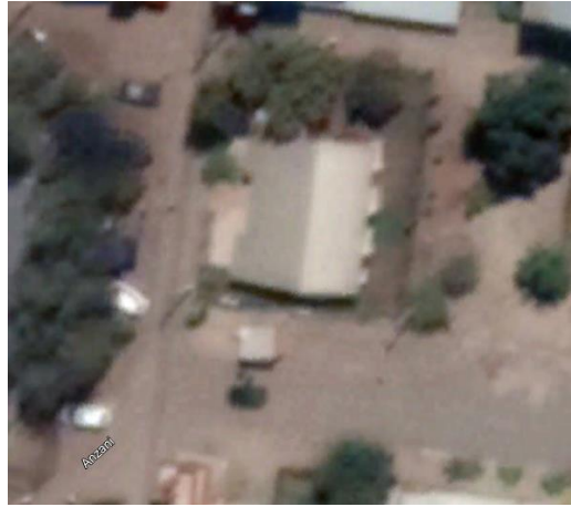
OCT.2019 (CONSTRUCCIÓN 10 M2 APROX.)