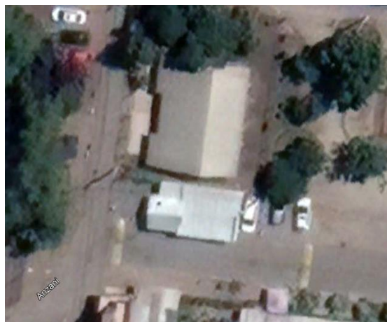
FEB 2021 (CONSTRUCCIÓN TOTAL DE 69 M2 APROX.)