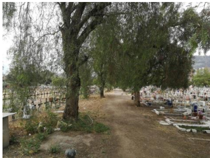
Mala configuración del límite y calle Los Aromos

Fotografía actual donde se aprecian alguna problemáticas