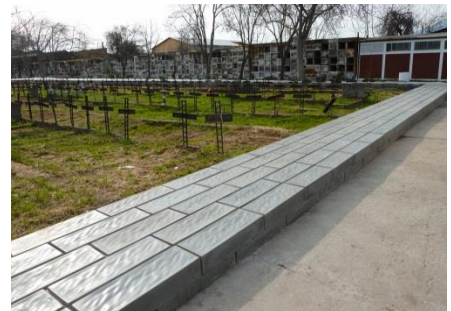
Monumento (Plaza Dura) que no invita a la Pausa y Reflexión. Falta Integración y ambientación.

El proyecto “Jardín de la Memoria Patio 29: pausa de contemplación y reflexión” busca identificar, consolidar y poner en valor el sitio de memoria Patio 29, a través de la intervención y consolidación del borde sur-calle Los Aromos , comprendiendo una superficie de 186 metros cuadrados, mediante un diseño paisajístico armónico (Jardín) que invite a la reflexión, permanencia y reconocimiento del lugar .