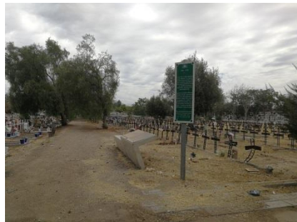
Problemática de Señalética Interpretativa.