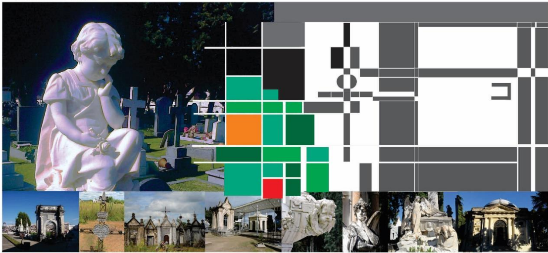
IMÁGENES DE CEMENTERIOS DE FLORIDA-DURAZNO-SAN JOSÉ FLORES - PAYSANDÚ - SALTO - CEN. CENTRAL DE MONTEVIDEO

OBRA ESCULTÓRICA DEL LOUIS WETSLIN EN EL CEMENTERIO BRITÁNICO Y SECTOR DEL MORAL DE EDWIN STODER URBANO DEL CEMENTERIO DEL NORTE AÑO: WELSH DAYBOO 1902 - MONTEVIDEO