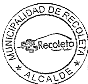
DANIEL JADUE JADUE ALCALDE MUNICIPALIDAD DE RECOLETA