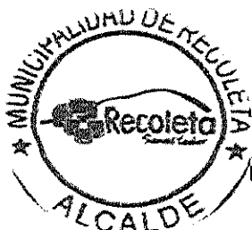
DANIEL JADUE JADUE ALCALDE MUNICIPALIDAD RECOLETA