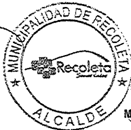
DANIEL JADUE JADUE ALCALDE MUNICIPALIDAD DE RECOLETA